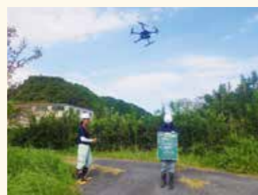
ドローンによる測量

無人航空機での起工測量を用いて堆積土量を算出し、施工はマシンコントロールを使用しバックホウにより正確に作業を行い、出来形測定は、施工履歴を基に算出。