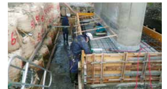
底版拡幅工・型枠組立