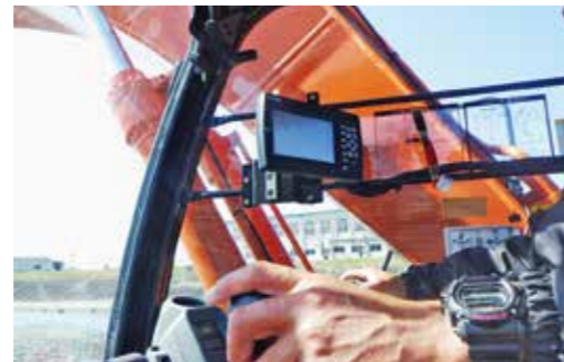
マシンガイダンス