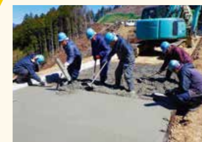
コンクリート舗装工

この林道は、川根本町青部地区から田野口地区につながる、林業専用道です。本年度の箇所は標高625m、気象条件が厳しく、コンクリート管理に注意を払いました。