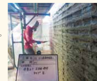
ポリマーセメントモルタル吹付け

本工事は大代橋（P1橋脚）の耐震補強工事である。フーチング部の拡幅後、ポリマーセメントモルタル巻立て補強工法（PP工法）により柱部を施工しました。吹付施工時は、材料品質及び、1層毎の厚さ管理に細心の注意を払いました。